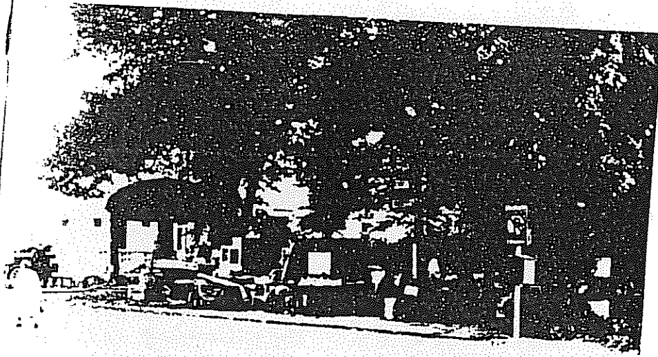
Aus brennenden Häusern gerettete Möbel vor dem Kriegerdenkmal am Oberntorwall.