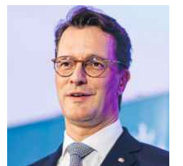
NRW-Ministerpräsident Hendrik Wüst (CDU).

Mängel an der wegen Baufähigkeit gesperrten Brücke waren schon länger bekannt. 2012 wurde eine Sanierung beschlossen, die 2014 zugunsten eines Neubaus verworfen wurde.