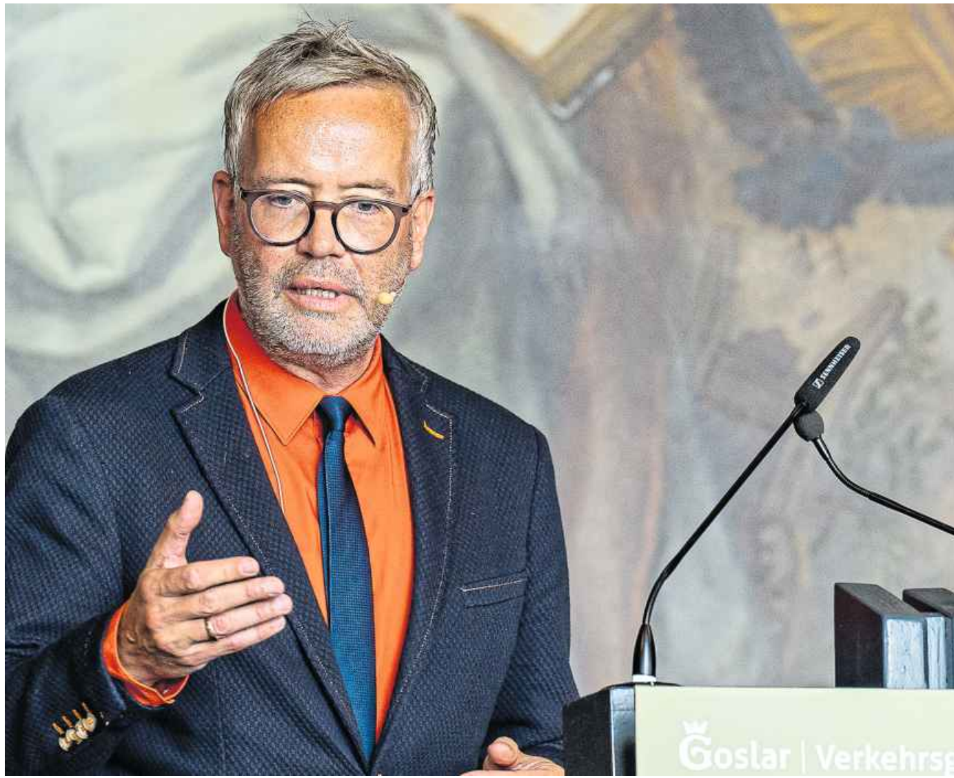
Der Bielefelder Juraprofessor Ansgar Staudinger ist Präsident des Deutschen Verkehrsgerichtstags.

Düsseldorf (Inw). Die Zahl der Selbsttötungen hinter Gittern ist in Nordrhein-Westfalen erneut gesunken. Im vergangenen Jahr hätten sich zwölf Gefangene umgebracht, ein Jahr zuvor seien es noch 15 gewesen, teilte das NRW-Justizministerium auf Anfrage mit. Im Jahr 2020 hatte sich die Zahl der Suizide in den nordrhein-westfälischen Gefängnissen mehr als verdoppelt. Sie sprang von 11 auf 23 Selbsttötungen.