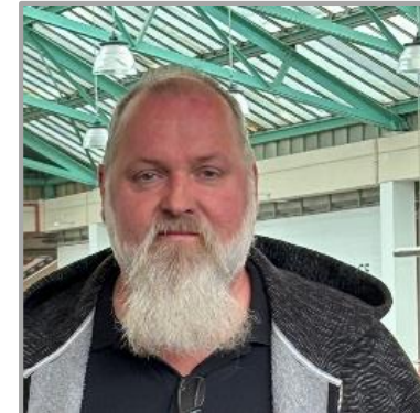
Horst Nosseler Fakultät für Biologie