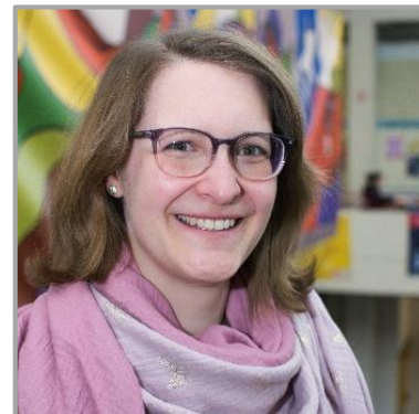
Marina Bunte Fakultät für Biologie